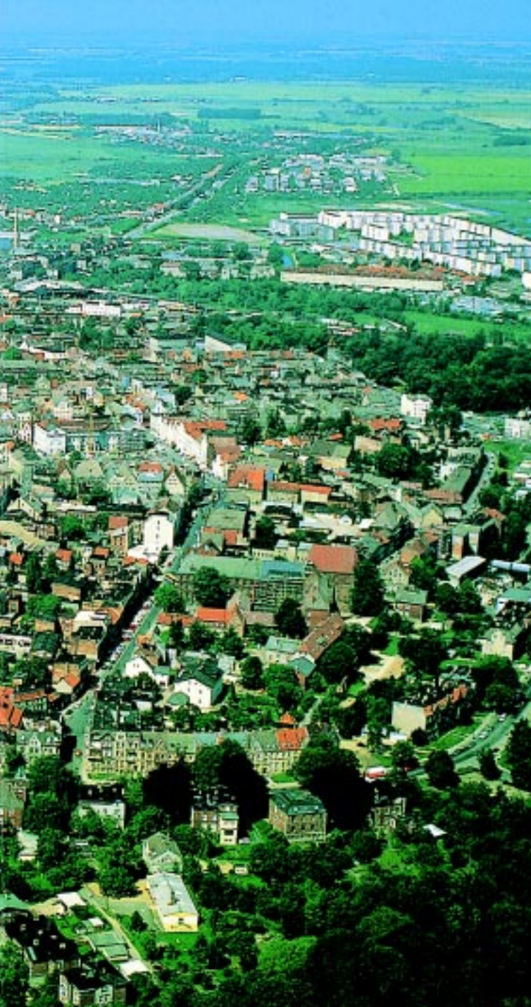
■ Verkehrsstruktur aus der Luft: Die Kreisstadt Wismar liegt im Nord- westen Mecklenburg-Vorpommerns am Ende der Wismarer Bucht.