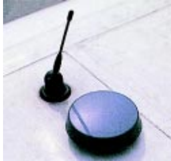
■ Angepeilt: Der Funkverkehr des Busses läuft über die Antenne auf dem Dach.