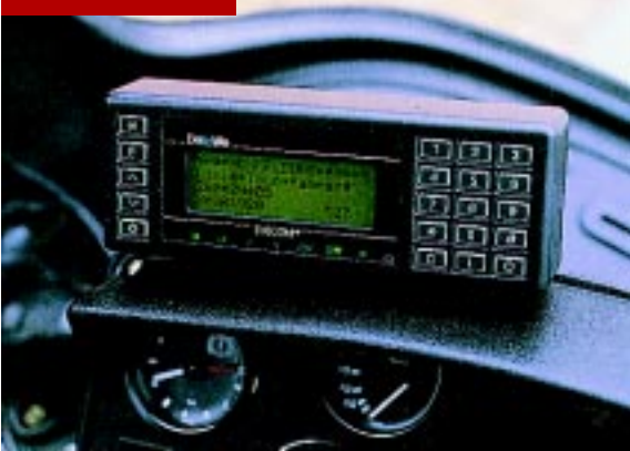
■ Nur eine Armlänge entfernt: Über das kompakte Bedienterminal Datcom 80-3 steuert der Fahrer das Bündelfunkmobilgerät UFM 871.